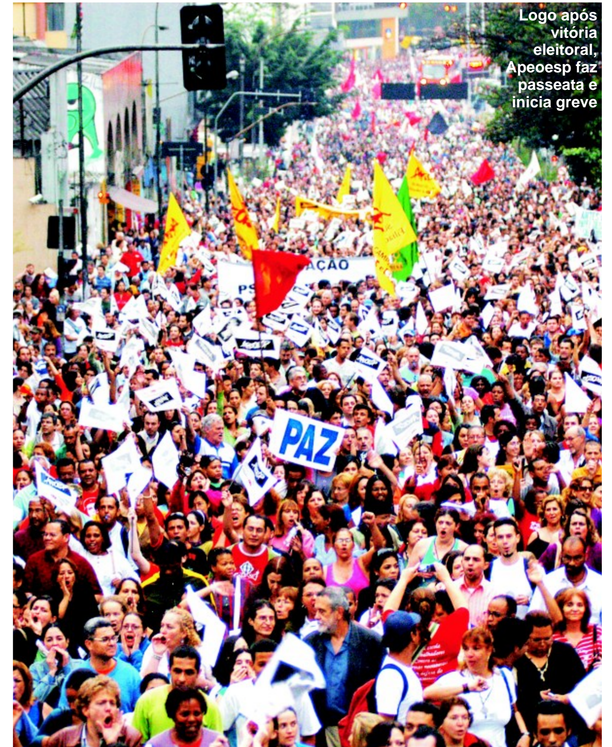
Logo após vitória eleitoral, Apeesp faz passeata e inicia greve