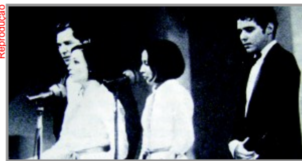
Chico, Tom e Quarteto Em Cy defendem "Sabiá"

No Brasil, a música popular, provavelmente mais do que qualquer outra manifestação cultural, teve papel fundamental na vida política do país. Há exatos 40 anos, a música "Sabiá" de Chico Buarque e Tom Jobim, ganhava o Festival Internacional da Canção de 1968.