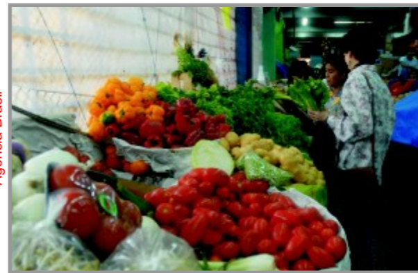
Mulheres escolhem frutas e legumes em sacolão

Mesmo assim – Não dá pra relaxar. Outra conclusão do estudo é de que a subida dos alimentos sempre prejudica as famílias que ganham menos, já que comida toma parte importante do orçamento. Para a renda familiar de até R$ 377, 49 mensais, o impacto da alta foi de 2,80% no último mês de maio. Para famílias com renda média mensal de R$ 2.792, o impacto cai para 2,14%.