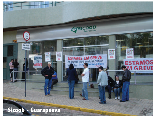
Sicoob - Guarapuava