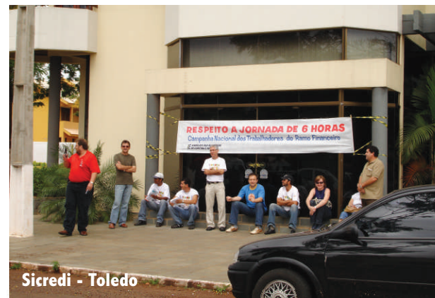
Sicredi - Toledo