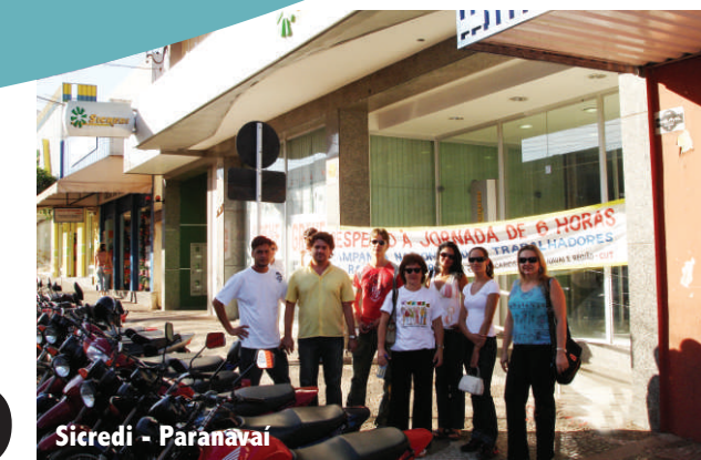
Sicredi - Paraná

Sindicalistas e assessores jurídicos dos sindicatos de bancários de todo o Paraná e membros das duas Federações de Bancários estiveram reunidos no dia 29 de março em Curitiba. O que une as duas Federações é o desejo de achar uma solução para o impasse criado pelas cooperativas, que tentam impor o aumento da jornada e impedir a renovação do Acordo Coletivo de Trabalho.