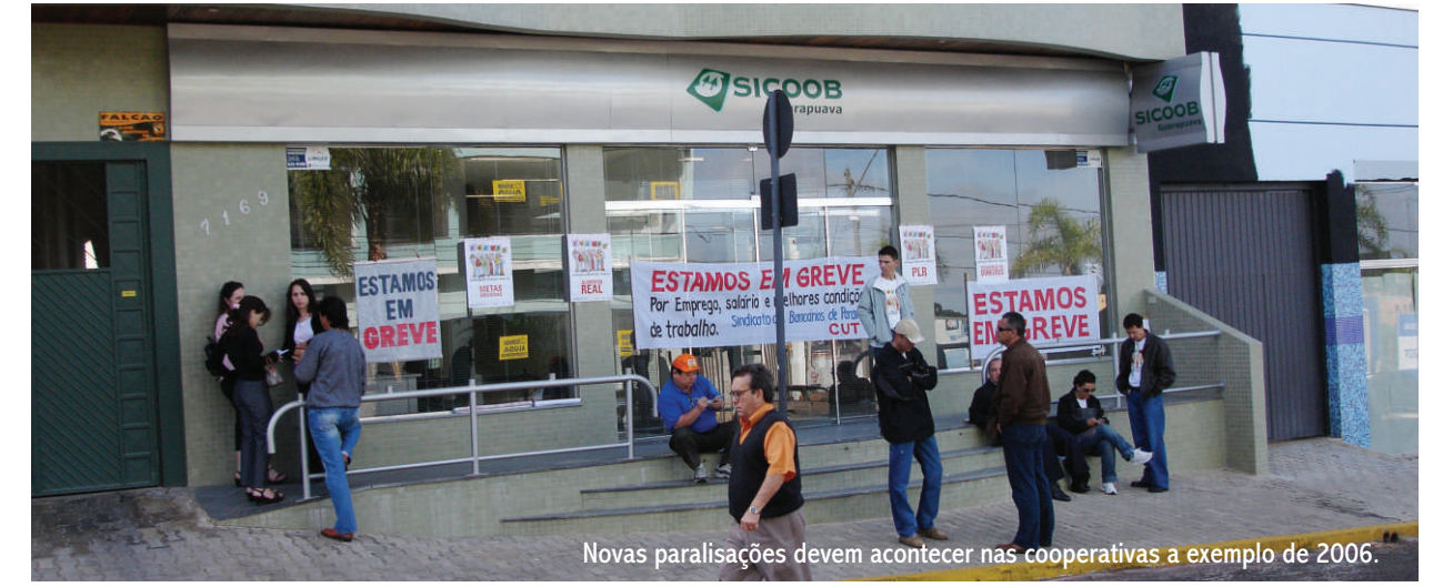
Novas paralisações devem acontecer nas cooperativas a exemplo de 2006.

1º de junho é a data-base dos Cooperativários (trabalhadores em cooperativas de crédito). É quando começa um ritual que deve ser realizado anualmente pelos sindicatos, antes mesmo que as negociações com os patrões tenham início. A minuta com as propostas feitas pelos trabalhadores e sindicatos, depois de elaborada, é apreciada pelo conjunto dos trabalhadores em assembleia. Uma vez aprovada, a minuta é encaminhada às direções das cooperativas.