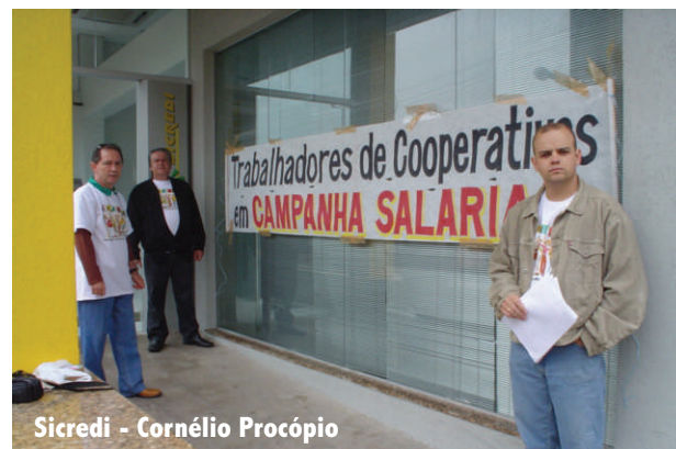
Sicredi - Cornélio Procopio