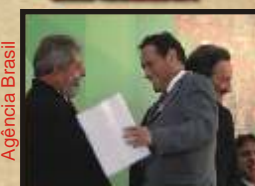
Lula e Artur no dia do envio da 151 e 158

14 de fevereiro Governo atende reivindicação da CUT e envia para o Congresso os textos das Convenções 151 e 158.