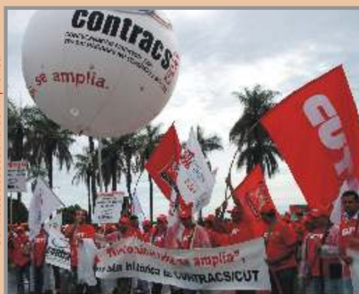
Contracs/assessoria de imprensa