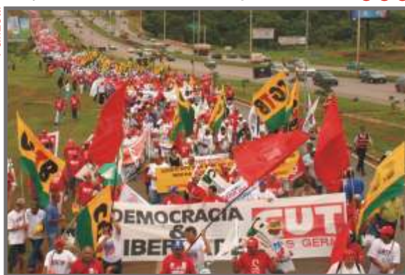
II Marcha, no final de 2005: vermelho a perder de vista