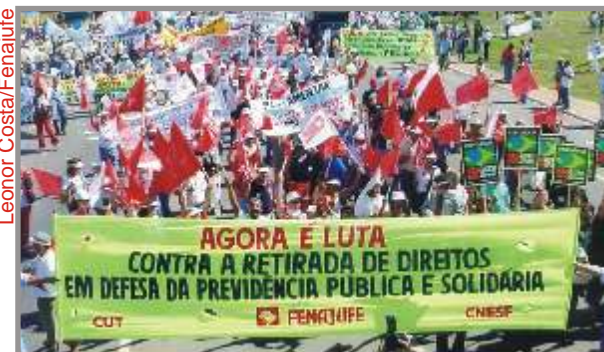
Durante mobilização em 2003, CUT reforça defesa da Previdência

À época, algumas das injustiças mais gritantes eram a não-aplicação da correção monetária sobre os bene-