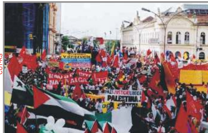
1º FSM, em Porto Alegre: em defesa de uma nova realidade para o mundo

Em 2001, a CUT esteve na linha de frente do lançamento do Fórum Social Mundial, que se afirmou como espaço da sociedade civil em