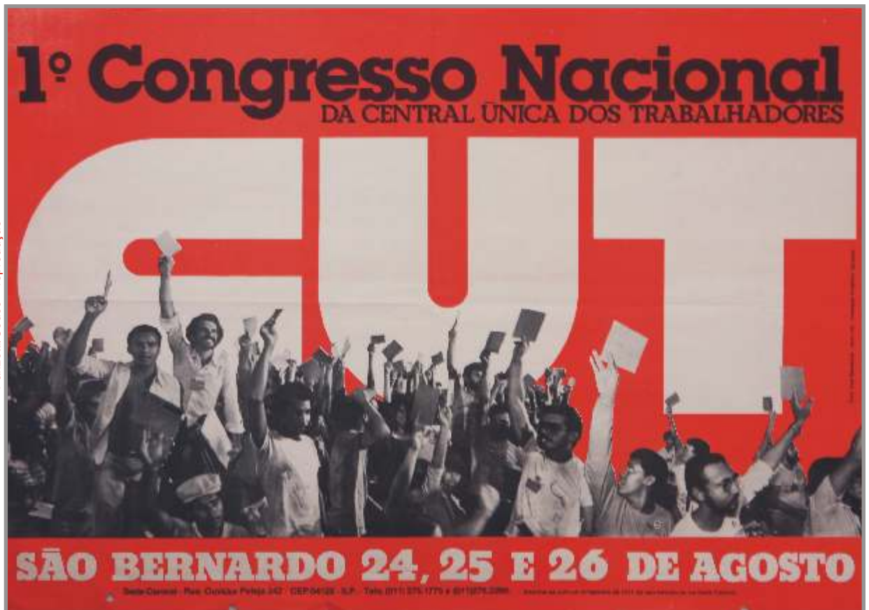
1º Congresso da Central estabeleceu Plano de Lutas para os anos seguintes