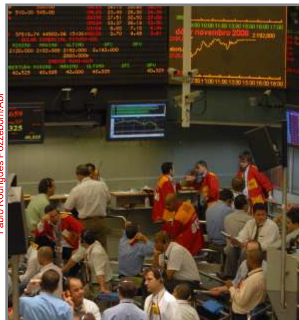
Cena da crise: desânimo na bolsa de valores

Por outro lado, a crise pode ser uma oportunidade de debater e criar uma nova regulação para o mercado financeiro. Portanto, é chegada a hora de regulamentar o artigo 192 da Constituição Federal, de forma a colocar o sistema sob controle social. Outras informações podem ser obtidas através de nota técnica de nossa subseção Dieese, à disposição em nossa página de internet.