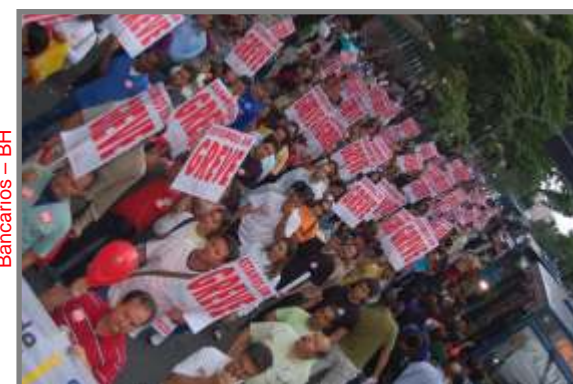
Bancários - BH