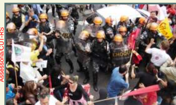
Brigada Militar tenta, mas não barra Marcha dos Sem

Diante do ocorrido, a CUT repudiou em nota oficial o “autoritarismo, a falta de diálogo, o desrespeito, a truculência fascista e a irresponsabilidade criminosa desses dois governos tucanos” que promoveram uma verdadeira guerra contra os manifestantes, com bombas, tiros e gás pimenta, que deixou vários feridos, inclusive à bala.