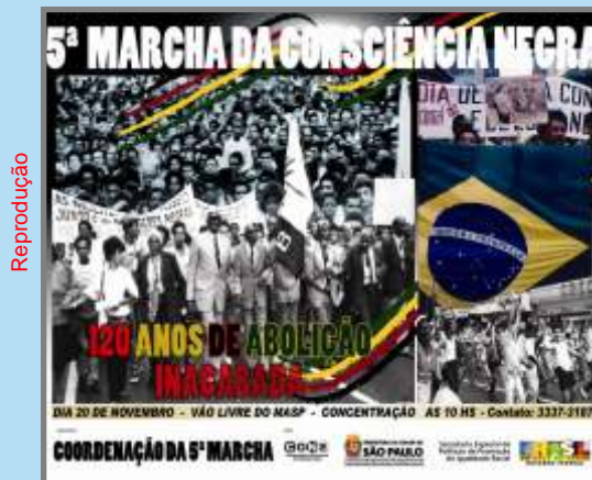
Cartaz anuncia a 5ª Marcha

Em 2008, o Dia Nacional da Consciência Negra, 20 de novembro, completará 30 anos. E a CUT participará da "5ª Marcha da Consciência Negra - 120 anos de Abolição Inacabada", que percorrerá da Avenida Paulista ao Teatro Municipal, em São Paulo. A data foi ratificada em 1978 pelo Movimento Negro Unificado, como uma homenagem a Zumbi dos Palmares, assassinado em 1695. Hoje, entre as principais lutas da CUT e das entidades que batalham contra o racismo estão a inclusão no mercado de trabalho e melhor distribuição de renda, aprovação do Estatuto da Igualdade Racial, acesso à saúde e educação com qualidade, o respeito às religiões de matrizes africanas e o combate ao machismo e à homofobia.