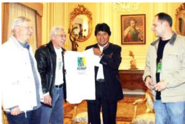
Encontro na sede do governo boliviano