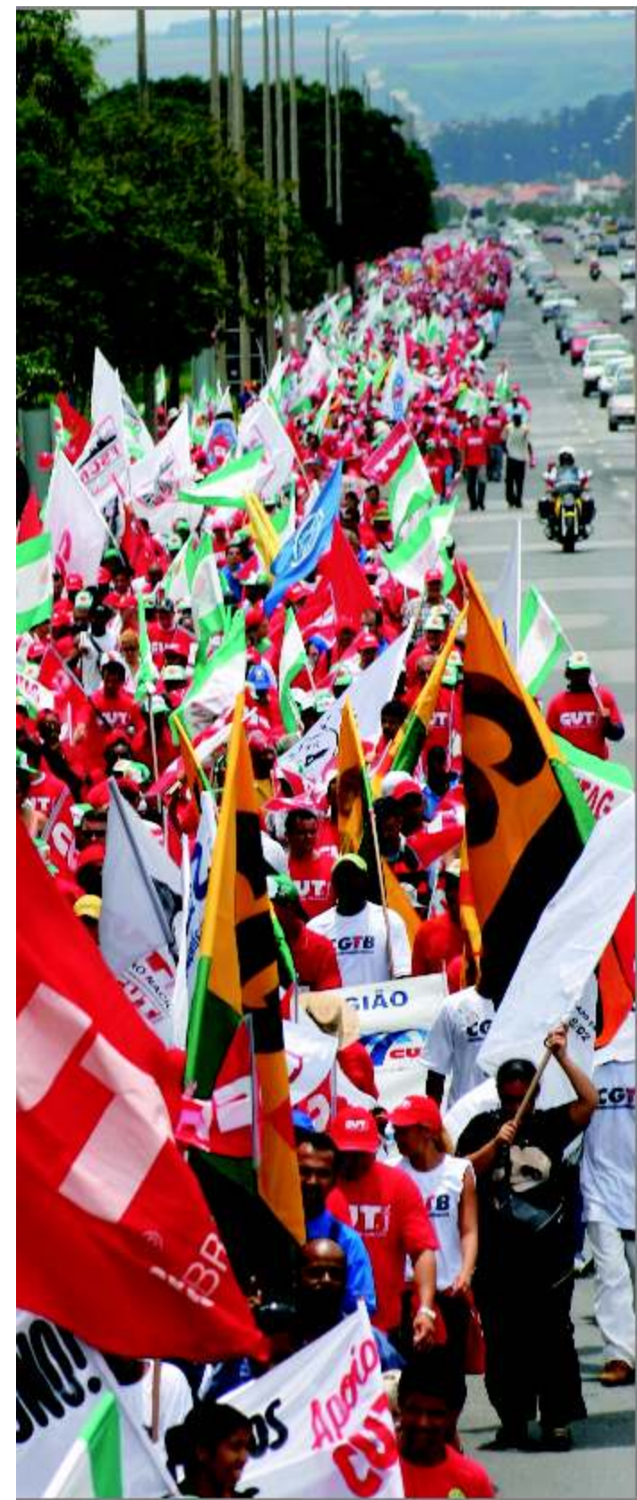
Parada dos Ministérios na 2ª Marcha

Em 2007, já batizada de 4ª Marcha Nacional da Classe Trabalhadora, a mobilização teve como mote a redução da jornada sem redução de salários e a ratificação das Convenções 151 e 158, entre outras bandeiras. ●●●